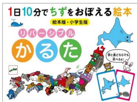
「1日10分でちずをおぼえる絵本 絵本版・小学生版 リバーシブルかるた」(エンスカイ)

※2 ソフトバンクロボティクス社のPepperを活用し、当社および白泉社、NCTが独自に開発したものです。