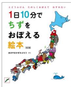
「1日10分でちずをおぼえる絵本 改訂版」(白泉社)